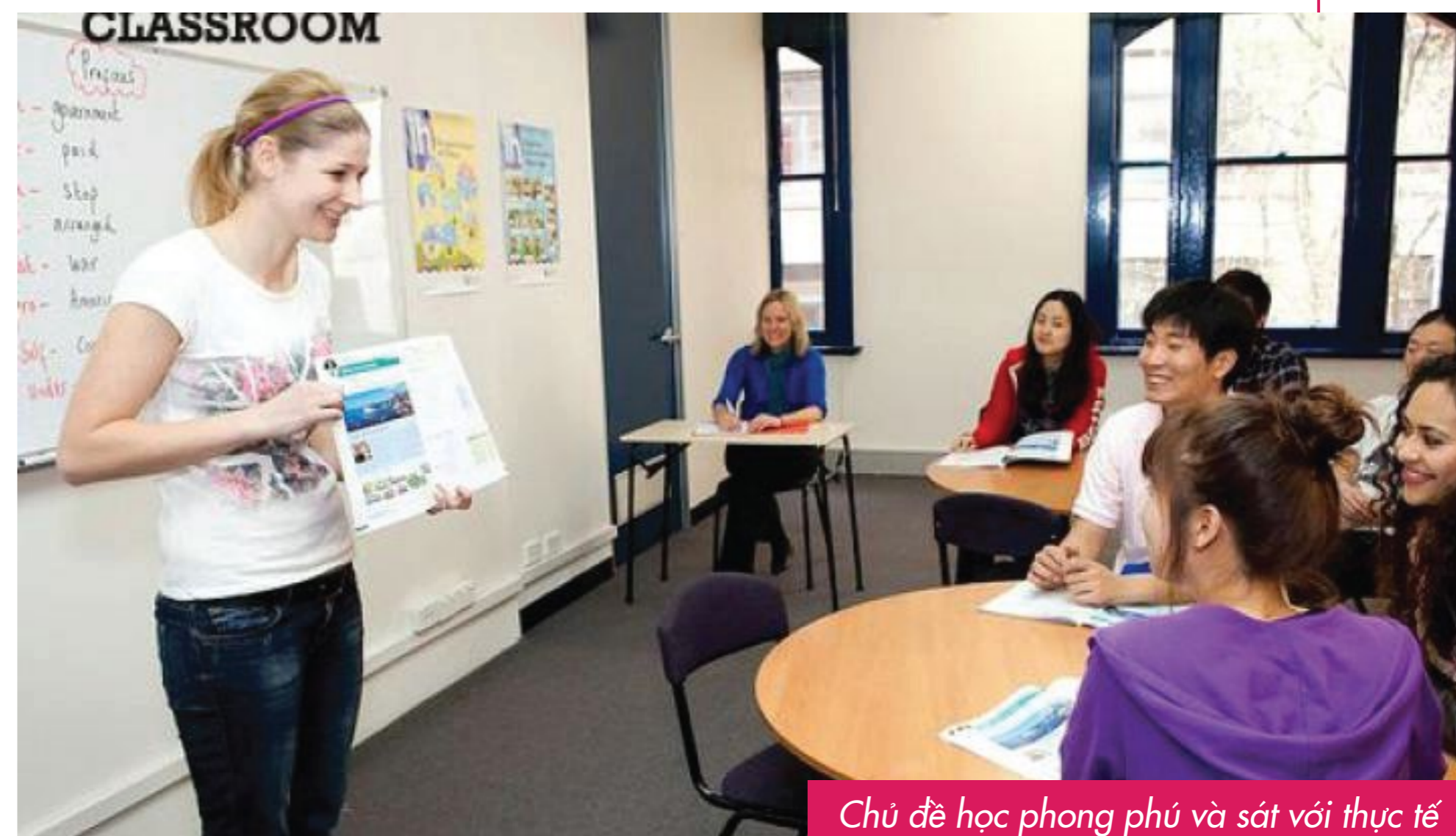
Chủ đề học phong phú và sát với thực tế