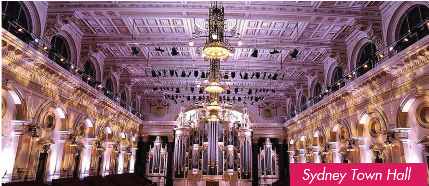
Sydney Town Hall