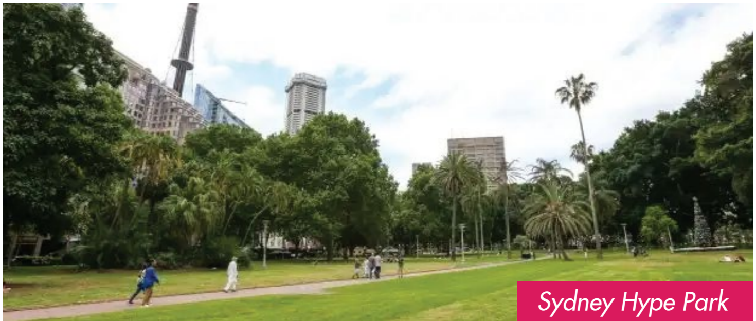
Sydney Hype Park