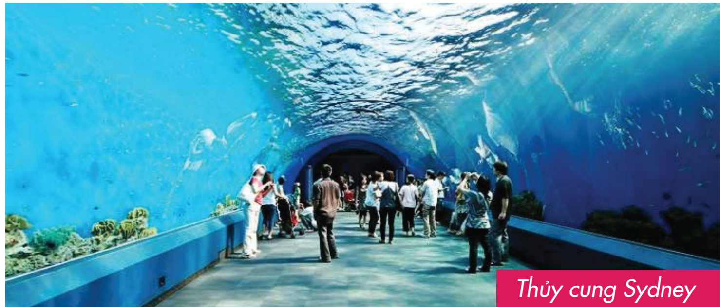
Thủy cung Sydney