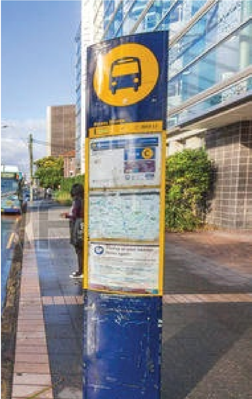
IH Sydney nằm ở khu vực trung tâm, giao thông thuận tiện.