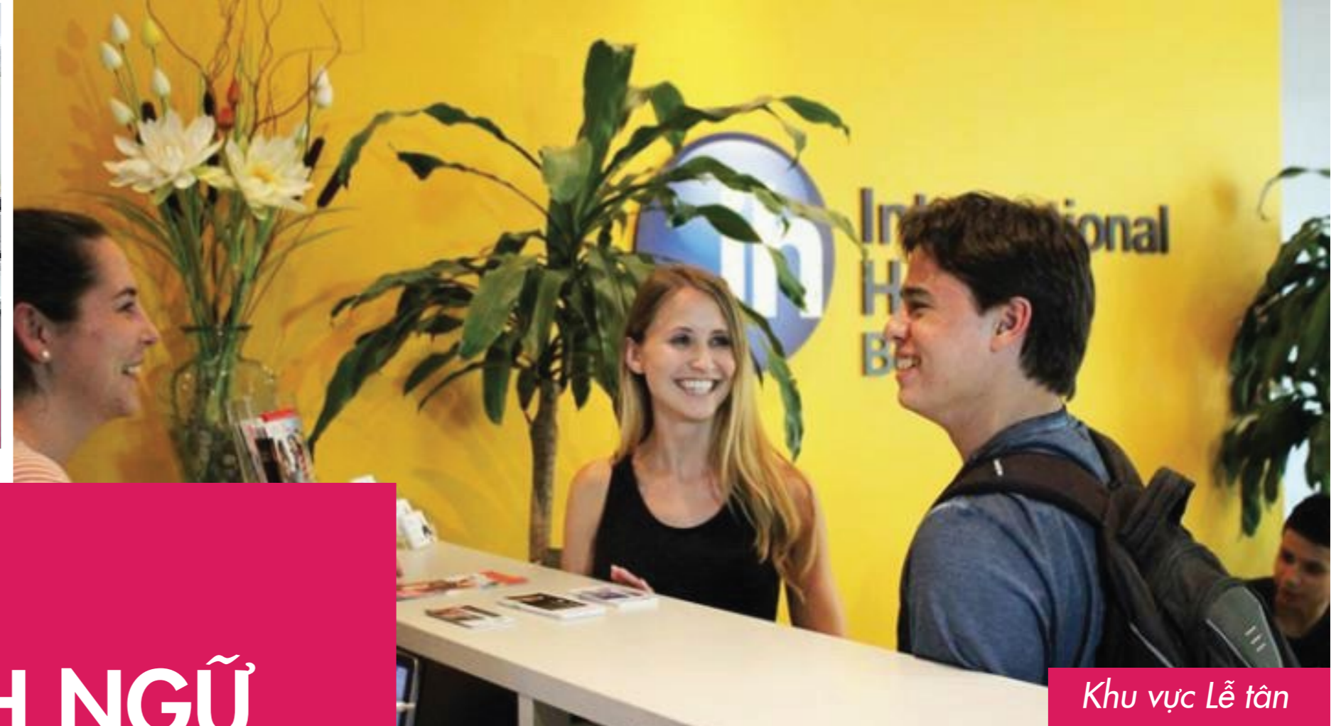
Khu vực Lễ tân