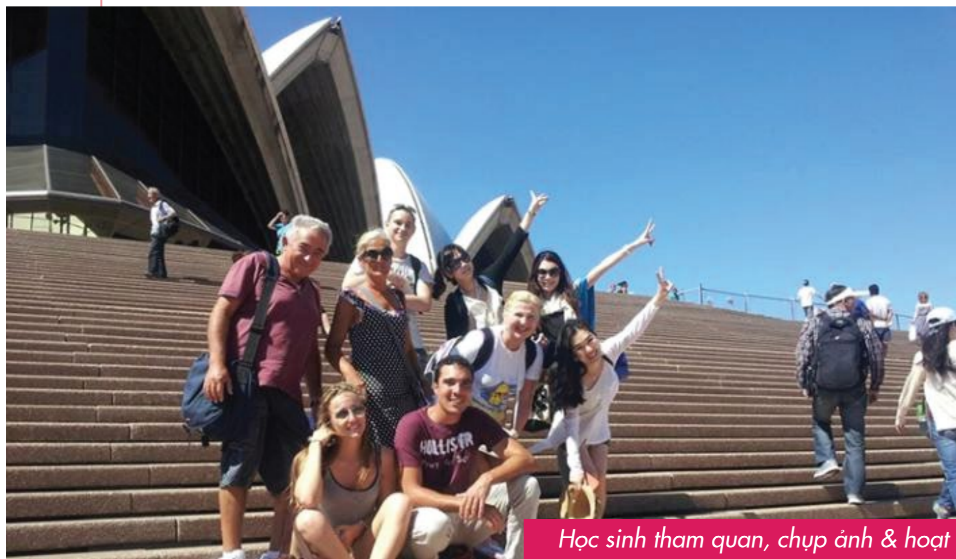
Học sinh tham quan, chụp ảnh & hoạt động nhóm tại Nhà hát Sydney

Nhà hát con sò nằm ở Bennelong Point, gần cầu cảng Sydney Harbour. Đây là một tác phẩm kiến trúc có một không hai, là một biểu tượng vô cùng đáng ngưỡng mộ của xứ sở kangaroo.