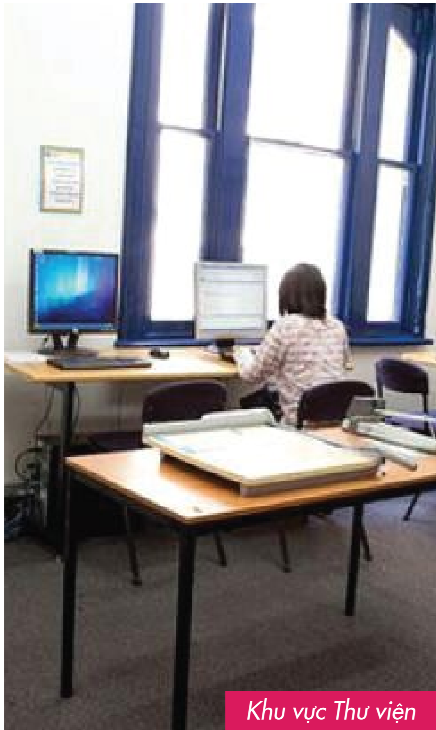
Khu vực Thư viện

Trường IH Sydney có sở vật chất tiên tiến, học sinh được sử dụng thư viện, wifi miễn phí, khu vực bếp, khu vực sinh hoạt chung, phòng sáng tạo nghệ thuật đạt chuẩn chất lượng cao giúp các em có không gian học tập và thực hành tốt nhất.