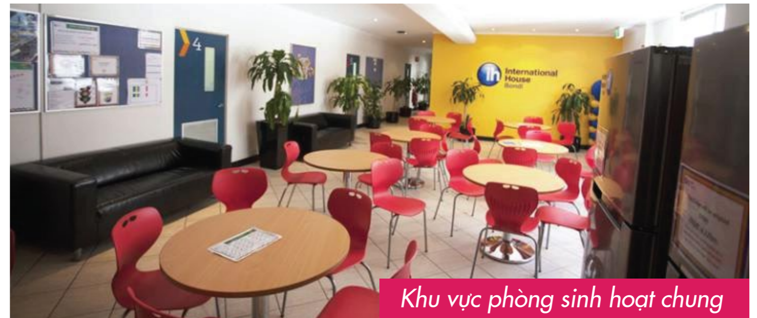
Khu vực phòng sinh hoạt chung