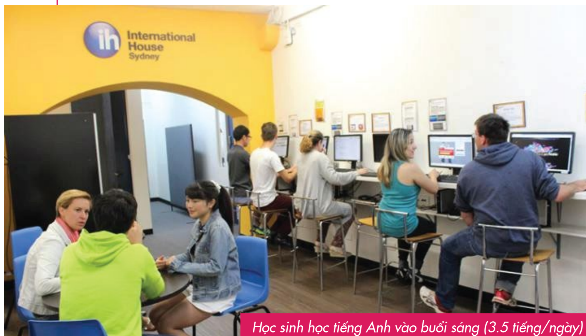
Học sinh học tiếng Anh vào buổi sáng (3.5 tiếng/ngày)