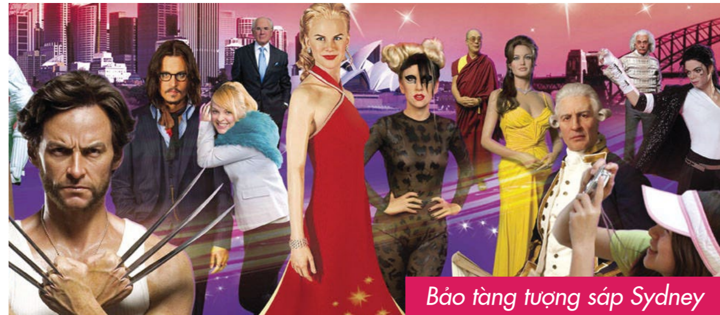
Bảo tàng tượng sáp Sydney