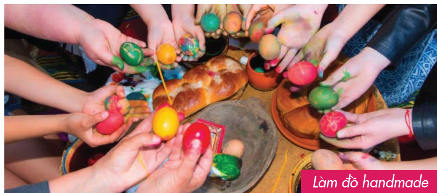
Làm đồ handmade