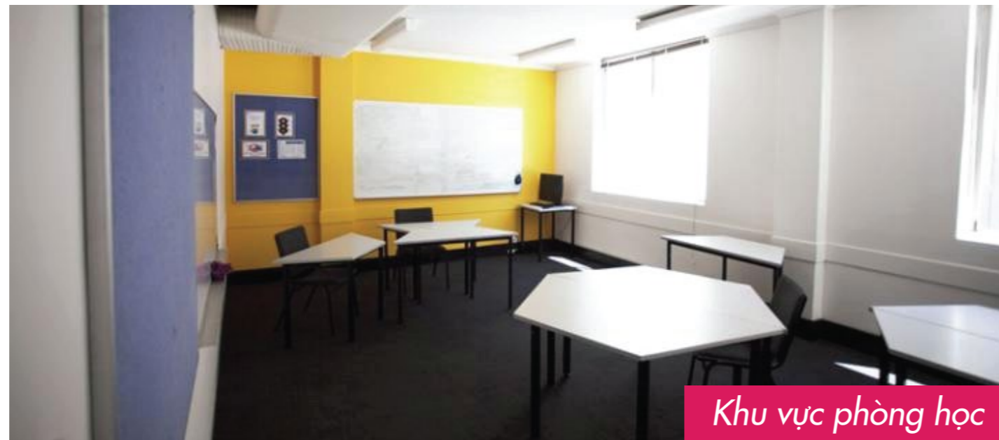
Khu vực phòng học