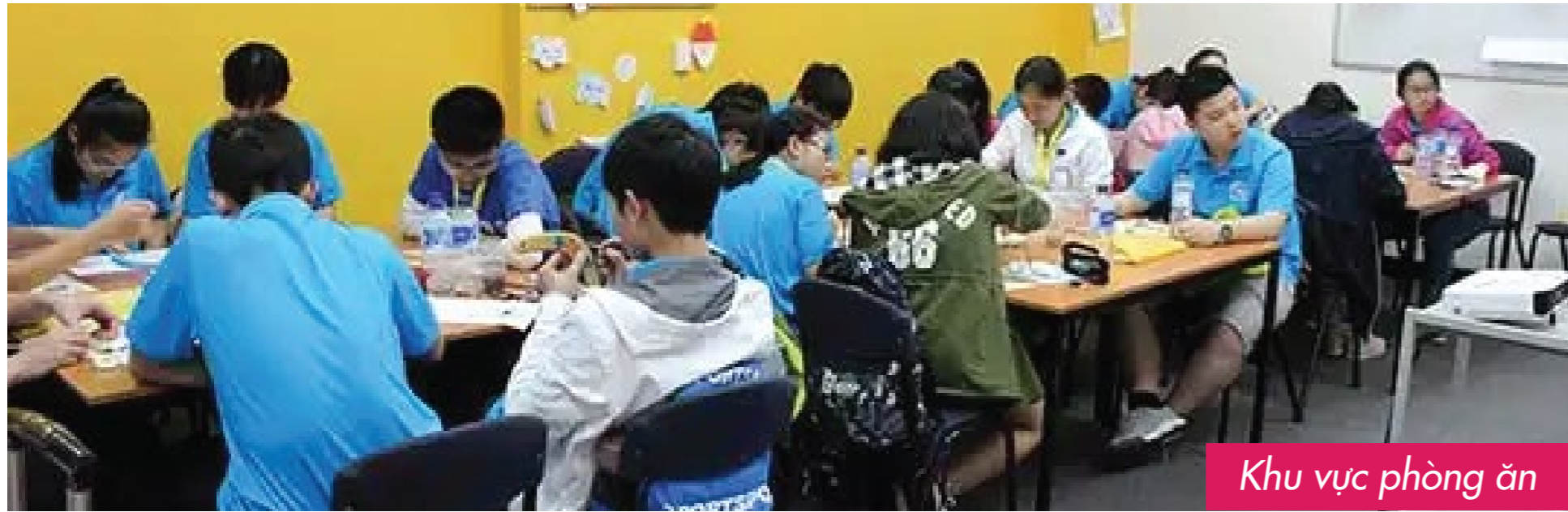
Khu vực phòng ăn