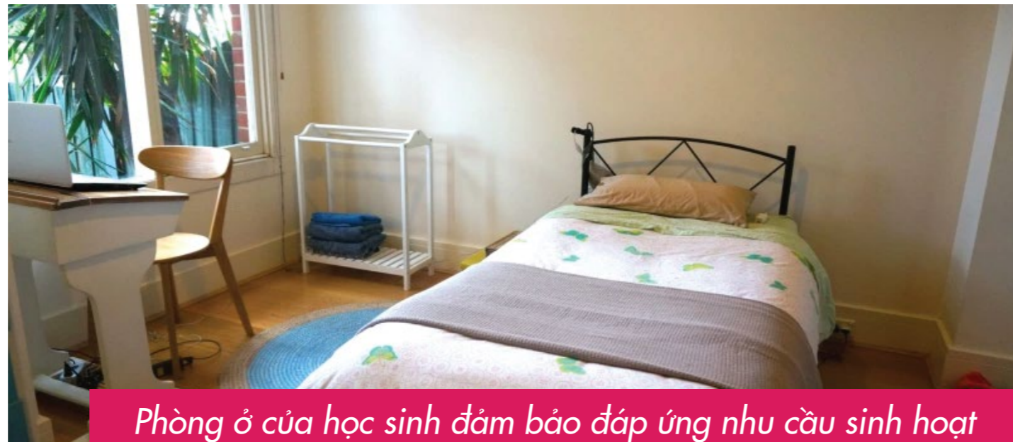
Phòng ở của học sinh đảm bảo đáp ứng nhu cầu sinh hoạt