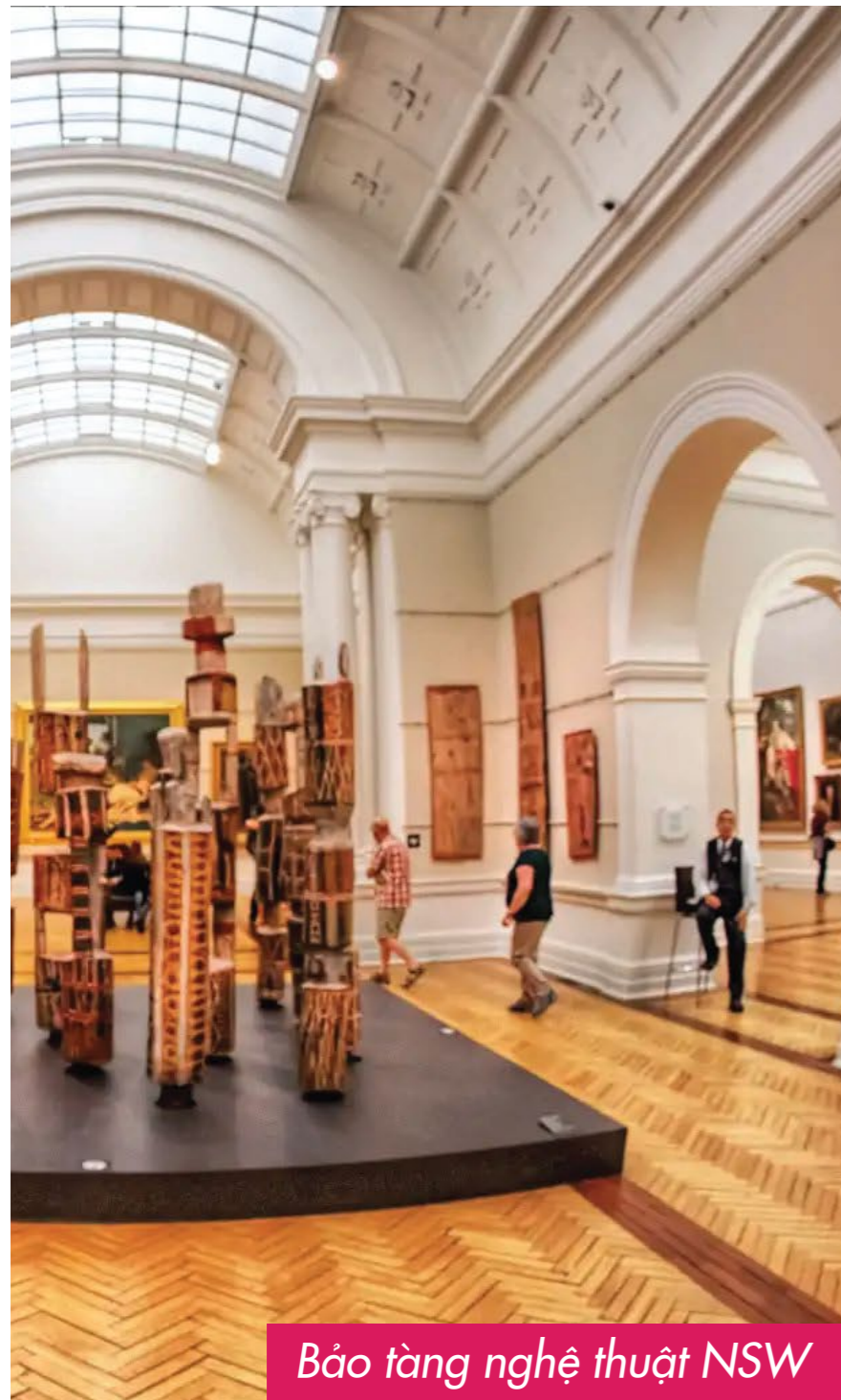
Bảo tàng nghệ thuật NSW