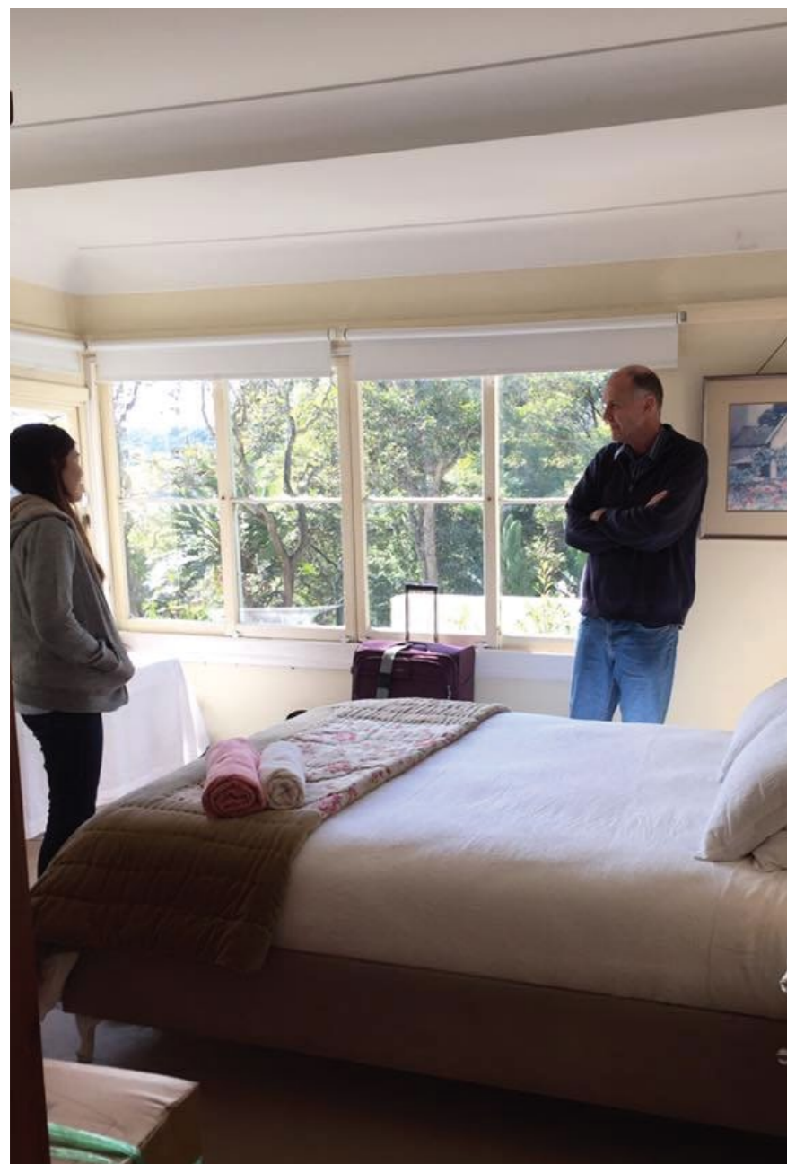
Chủ nhà homestay được cấp giấy phép của chính phủ.

Du học hè 2018 tại Sydney cùng Annalink/OSHCstudents, học sinh được trải nghiệm sống cùng người bản xứ tại mô hình nhà homestay. Ở đây các em không chỉ tăng thêm vốn tiếng Anh qua giao tiếp hàng ngày mà còn được tiếp cận với môi trường sống "rất Úc" với những nét văn hóa đặc trưng của con người thân thiện nơi đây.