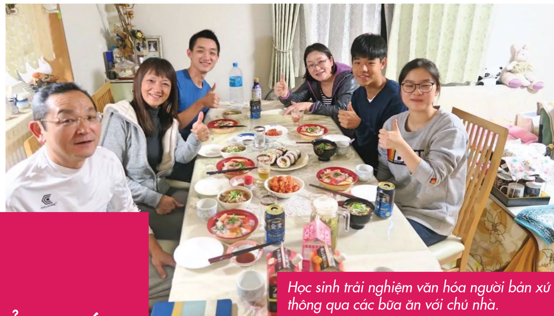
Học sinh trải nghiệm văn hóa người bản xứ thông qua các bữa ăn với chủ nhà.