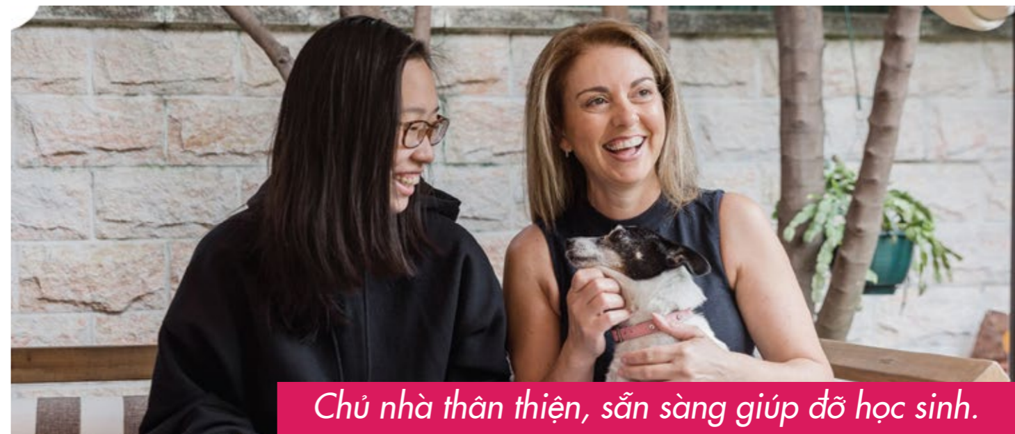
Chủ nhà thân thiện, sẵn sàng giúp đỡ học sinh.